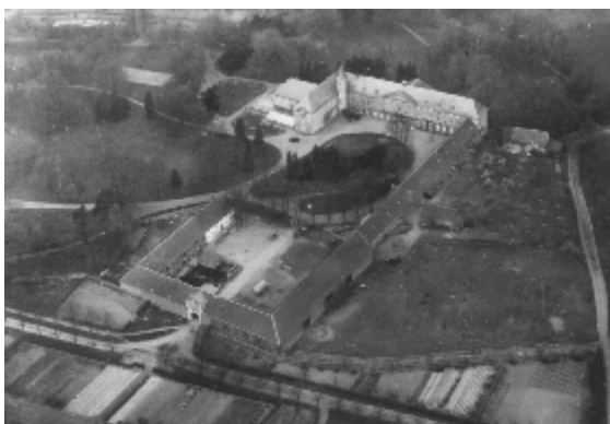
Abbildung 2: Zeppelinaufnahme 1913