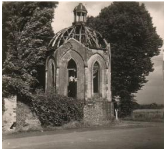
Abbildung 7: Pavillon um 1955

In einem Brief an den Landeskonservator vom April 1962 beklagte sich der Heimatkreis über den schlechten Zustand des Pavillons. Schon 1955 hatte die Gemeinde Büderich die Renovierung des Teehäuschens gefordert. 21 Es sollte noch