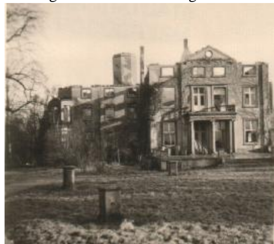
Abbildung 3: Schloßruine 1943

Im August 1943 wurde das Schloss und Teile der Wirtschaftsgebäude bei einem Luftangriff schwer beschädigt. Während