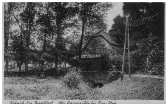
Abbildung 5: Mühle Haus Meer

Formale Strukturen für den Erhalt und die Pflege von Kulturgütern gab es schon lange. Nur fand der Denkmalschutz sehr selten bei politisch Verantwortlichen und der Mehrheit der Bürger Unterstützung. Schon weit vor dem 2. Weltkrieg wurde die Gemeinde Büderich ermahnt, die Ausgrabungsgesetze vom 26.3.1914 mit den Ausführungsbestimmungen vom 30.5.1920 und dem Durchführungserlass vom 11.3.1927 zu beachten. 15