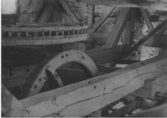
Abbildung 6: Holzernes Mühlwerk

1934 forderte der Landrat vom Bürgermeister in Büderich eine Zusammenstellung wichtiger Kulturdenkmäler. Dazu sollte ein Fragebogen für jedes Denkmal ausgefüllt werden. Am 2.10.1934 wurden die ausgefüllten Fragebögen zu folgenden Denkmälern an den Landrat in Grevenbroich geschickt: